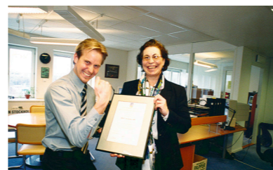
2000: DGC firar ISO 9001 och 14001-certifiering.