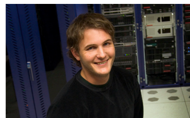
2002: DGC börjar etablera sig i Telias telestationer och bygger ett eget nät.