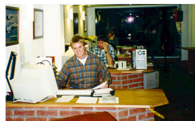
1993: Säljlandskapet i DGCs andra butik på Odengatan.