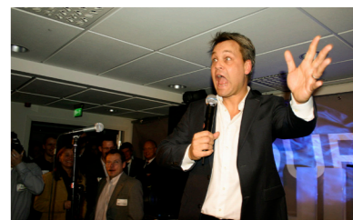
2005: Invigning av DGCs nya lokaler på Sveaplan med lansering av tjänsteerbjudandet One Source IT.