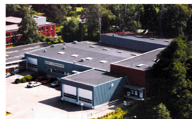
2000: DGCs PC-fabrik i Täby.