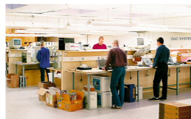
1996: PC-tillverkning på Sveaplan.